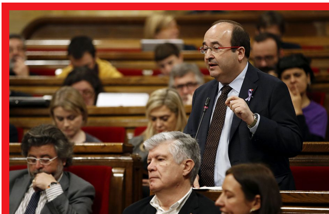
El líder del PSC, Miquel Iceta, en el Parlament de Catalunya

El president del grup parlamentari socialista, Miquel Iceta, ha exigit al president de la Generalitat, Carles Puigdemont, que comuniqui el més aviat possible al Parlament de Catalunya quins són els plans del Govern per organitzar el referèndum sobre la independència de Catalunya. "Si vostè ja té data i pregunta al cap hauria de comunicar-ho al Parlament. Si vostès ja tenen el projecte de llei de transitorietat jurídica preparat l'haurien