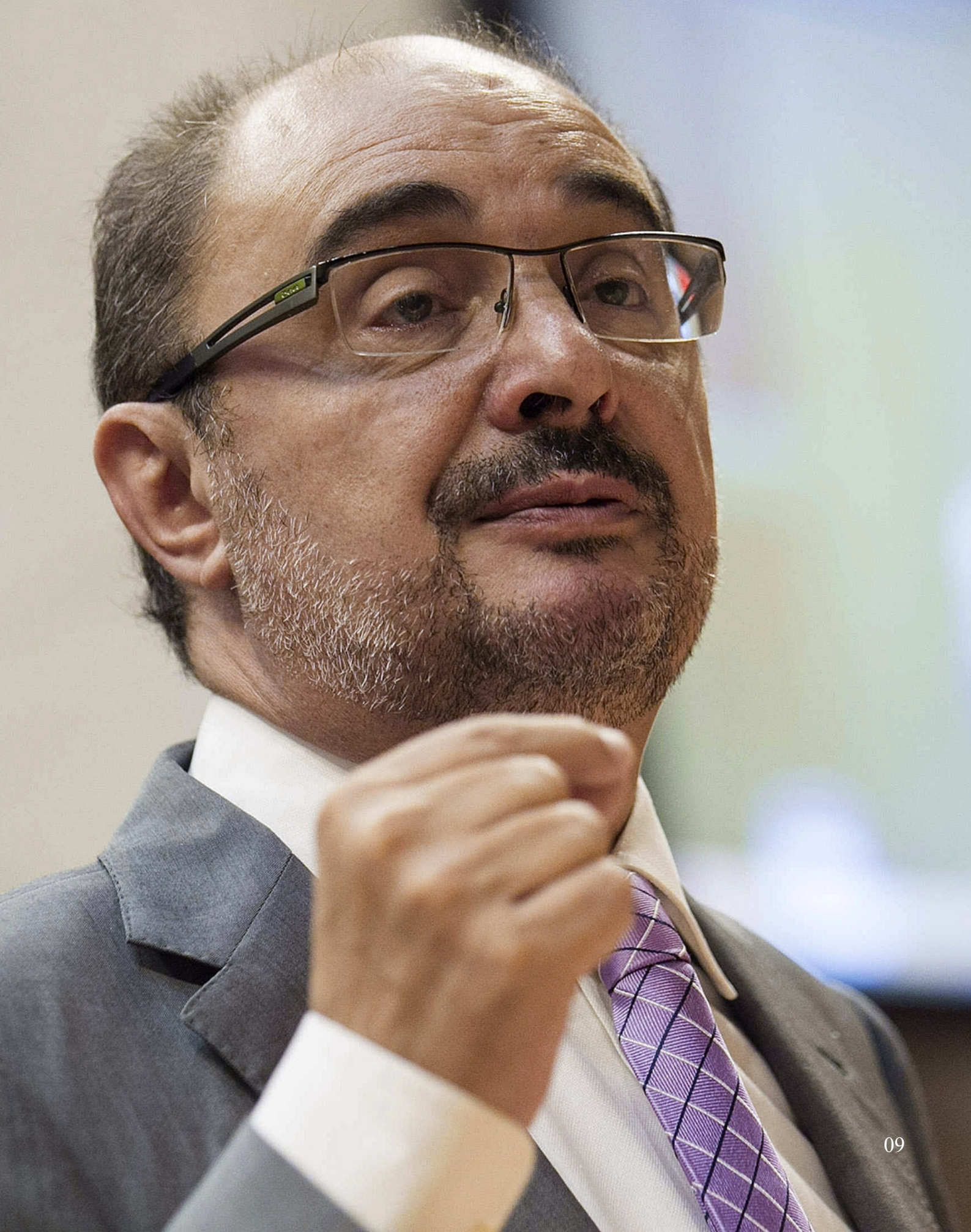
El Presidente de Aragón, Javier Lambán